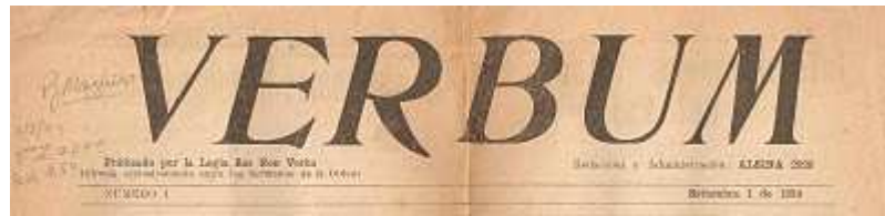
Verbum, N° 1, 1934.